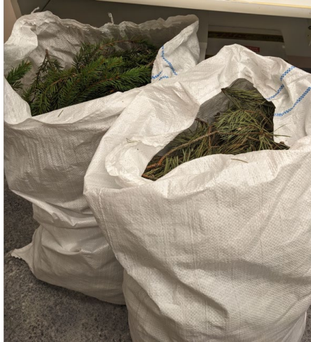
1. att. Egļu skuju un sīko zaru maisījums (maisā pa kreisi) un priežu skuju un sīko zaru maisījums (maisā pa labi)

Lai izpētītu iespēju pēc iespējas ilgāk saglabāt skuju īpašības, sadarbībā ar Institutu “BIOR” tika izmēģināta liofilizācijas (žāvēšanas aukstumā) procedūra (2. att.). Tika izmantoti šādi parametri: