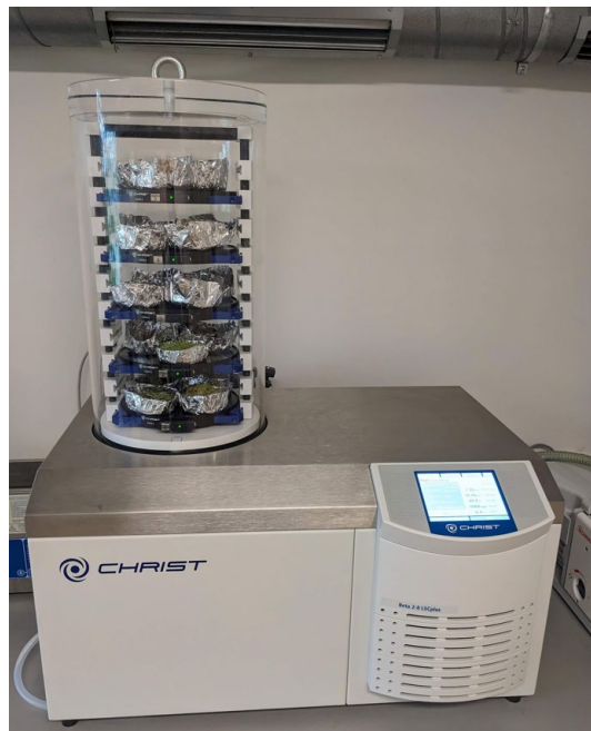
2. att. Liofilizācijas iekārta

Rezultātā tika iegūti paraugi, kas ir ērti pārstrādājami un stabili ilgāku laiku (3. att.).