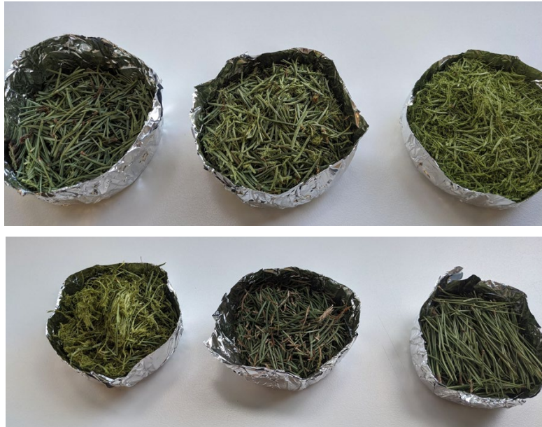
3. attēls. Egļu (augšā) un priežu (apakšā) skuju un zaru paraugi pēc dažādām samalšanas procedūrām un liofilizācijas procesā

Darbības īstenošana tiks turpināta nākamajā pārskata periodā.