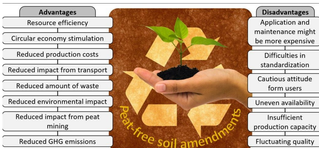
6. attēls. “Bez kūdras” augsnes ielabotāju priekšrocības un trūkumi. (Vincevica-Gaile et al., 2021). ( https://www.eubia.org/cms/wiki-biomass/bio-based-products/bio-based-soil-improvers/ ) ( https://ec.europa.eu/newsroom/growth/items/366108/en ).

Literatūras studijas norāda uz sapropeli, kā vērtīgu resursu augsnes kvalitātes uzlabošanā, tomēr, praktiskās pielietošanas metodes ir specifiski dažādiem reģioniem, augsnes tipiem, lauksaimniecības veidiem, augu kultūrām u.c. Turklāt, no dažādiem ezeriem iegūtā sapropeļa īpašības var būtiski atšķirties pat vienas valsts robežās. Svarīgi izstrādāt augsnes ielabotāja formulējumu (ar sapropeli, kā sastāvdaļu), kurā nodrošinātu pilnvērtīgu piedevu augsnes struktūras, mitruma u.c. agroķīmisko īpašību sabalansēšanu (Līpenīte un Kārklīšs, 2011). Priekšrocības sapropeļa un koksnes blakus produktu kombinēšanai ir aprakstītas zinātniskajā literatūrā, tomēr, kā koksnes izcelsmes sastāvdaļa, pārsvarā tiek minēta bioogle. Būtu svarīgi izpētīt citu koksnes materiālu pielietošanas iespējas. Ņemot vērā sapropeļa un koksnes materiālu sorbcijas spējas, ir nepieciešams izskatīt izstrādāto formulējumu vairākus pielietošanas scenārijus, t.i., lauksaimniecībai un augsnes remediācijai. Būtu nepieciešams ņemt vērā sapropeļa izmantošanas ietekmi uz augsnes saglabāšanu, oglekļa piesaisti, barības vielu apsaimniekošanu, bioloģisko daudzveidību, augsnes ūdens kvalitāti un tā iespējamo ietekmi uz barības ķēdi, kā arī augsnes bioloģisko sistēmu darbību un integritāti (Booth et al., 2007).