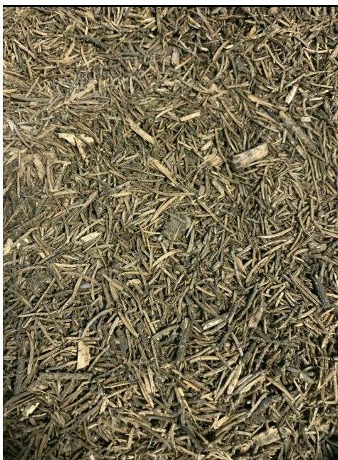
4. attēls. No partneriem saņemtā izejviela (skujas)

Izejviela tika žāvēta 2 nedēļas 20–25°C temperatūrā, plāni izklājot to uz kartona virsmas labi vēdināmā telpā. Pēc žāvēšanas analizējamās izejvielas mitrums bija robežās no 12 līdz 14%. Ir zināms, ka paaugstinātā temperatūrā, turot zem spiediena mitru izejvielu, veidojas tvaiks, un pēc spiediena noņemšanas no plātnes var veidoties delaminācija plātnes biezumā, kas var radīt neatgriezeniskas sekas, būtiski samazinot plātnes kvalitāti. Lai novērtētu, kāds izejvielas mitrums ir piemērotāks plātņu veidošanai, izejviela pēc pirmā žāvēšanas posma tika dalīta divās frakcijās, iegūstot vienu izejas paraugu ar mitruma saturu \approx 13,2\% un otru izejas paraugu, kuram tika veikta papildus žāvēšana 40 \pm 2^\circ\text{C} līdz mitruma saturam 3–5%. Abas frakcijas tika homogenizētas, kondicionētas un sagatavotas plātnes veidošanai pie viena izvēlētā spiediena, laika un temperatūras.