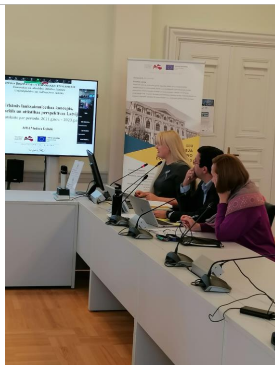
Ekspertu sēde 27.11.2023.