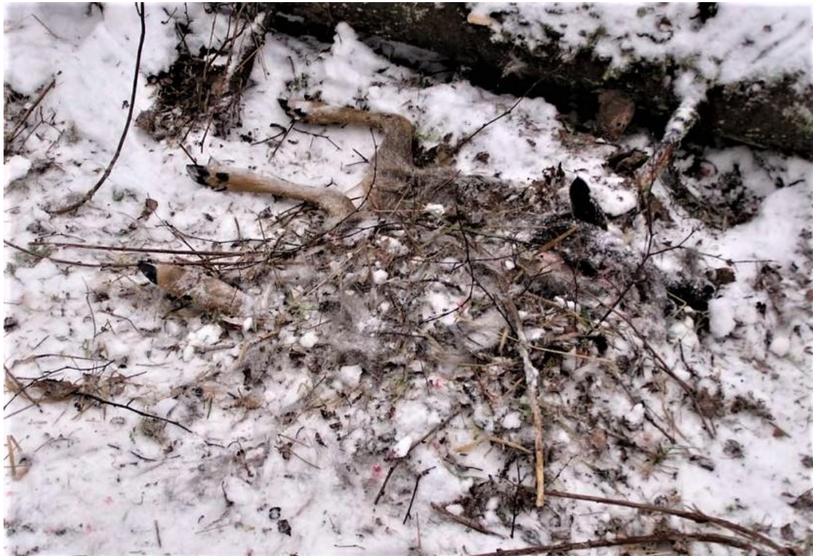
Lūša ar zariem apslēptas stirnas ķermenis