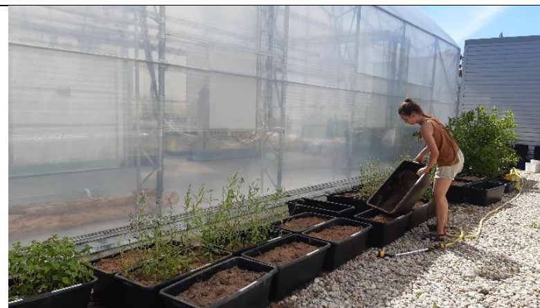
Ekspieriments modelētā vidē – augsnes ielabošana

Uzsākta atlasītā Baltā vītola vīrišķā klona "Platonis" pavairošana.