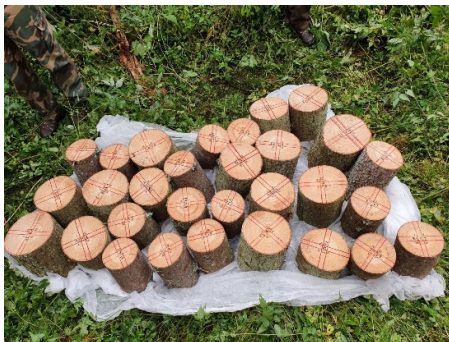
1. attēls. Izolātu un to suspensiju maisījumu pārbaude egles koksne lauka apstākļos

2020. gada septembrī ierīkots eksperiments lauka apstākļos, kur egles koksne pārbaudīja suspensiju efektivitāti pret Heterobasidion spp. bazīdijsporu infekciju (1. attēls). Iegūtie rezultāti liecina, ka vairāki izolāti un to maisījumi ir 3 cm dziļumā aizņem, lielāku relatīvo laukumu, salīdzinot ar līdz šim izmantoto bioloģisko preparātu “Rotstop”(2. attēls).