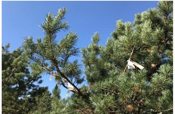
3.2.4.attēls. Četrgadīgs ramets