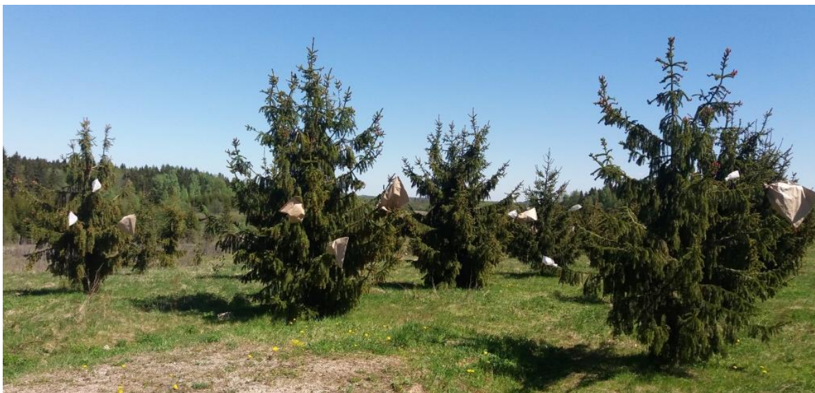
3.6.1. attēls. Sievišķo strobilu izolācija kontrolētajai krustošanai sēklu plantācijā Liuza

Tā kā egles sievišķā ziedēšana sākas vēlāk nekā vīrišķā, tad kontrolētajai krustošanai šajā pavasarī izmantoja gan svaigi ievāktos 11 klonu putekšņus, gan 14 klonu putekšņus no 2014. gada kolekcijas, veidojot ar katru no tiem 3 dažādas kombinācijas. Kontrolētajai krustošanai sievišķo strobilu izolācija veikta 16. un 17. maijā, uzliekot 102 izolācijas maisus 34 kloniem (19 Rēzeknes ĢRM un 15 Maltas ĢRM izcelsmes) sēklu plantācijā “Liuza” (3.6.1. att.). Apputeksnēšana veikta divas reizes – 18. un 21. maijā. Arī šogad ne visi uzliktie izolācijas maisi veiksmīgi saglabājās līdz apputeksnēšanās beigām, dažus negaisa laikā saplōsīja vējš vai arī izolētais zars tika nolauzts ar visu maisu. Izolācijas maisi noņemti 30. maijā, uzskaitot dzīvus un bojā gājušos čiekurus. Jau, noņemot maisus, bija redzami arī līki čiekuri, kas liecina par egļu čiekuru sviļņa ( Dioryctria abietella ) kāpuru radītu bojājumu, daži neattīstījušies – acīmredzot sala bojāti jau pirms izolācijas maisu uzlikšanas. Atkārtota krustojumu apsekošana, čiekuru vitalitātes pārbaude un uzskaitē veikta augustā, bet, čiekuru novākšana sēklu ieguvei – 3. novembrī, ievākti čiekuri no 91 krustojumu kombinācijas (3.6.1. pielikums). Starpatskaites sagatavošanas laikā notiek čiekuru žāvēšana un sēklu ieguve.