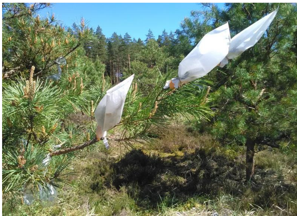
3.2.1.attēls. Ziedu izolācija