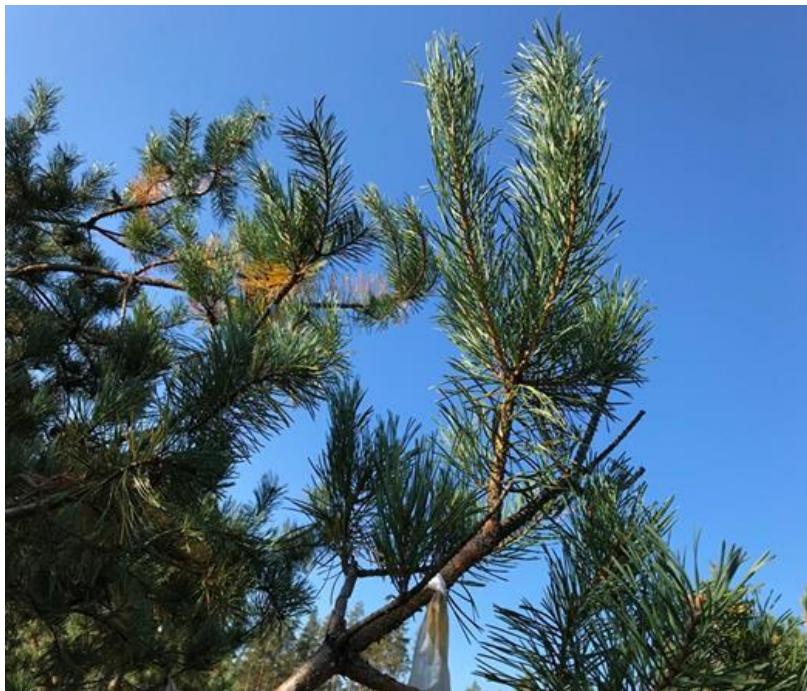
3.2.3. attēls. Divgadīgs ramets